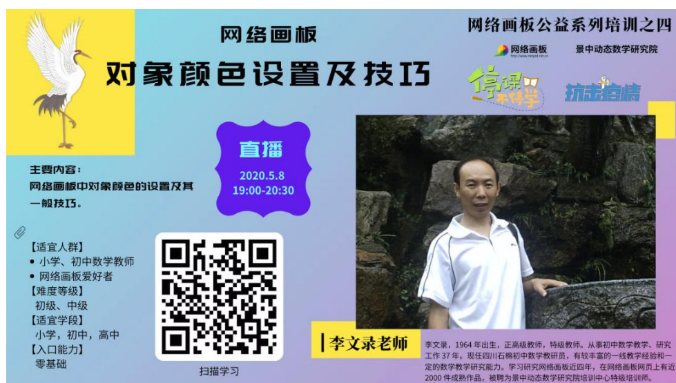
2020 年，疫情期间公益培训