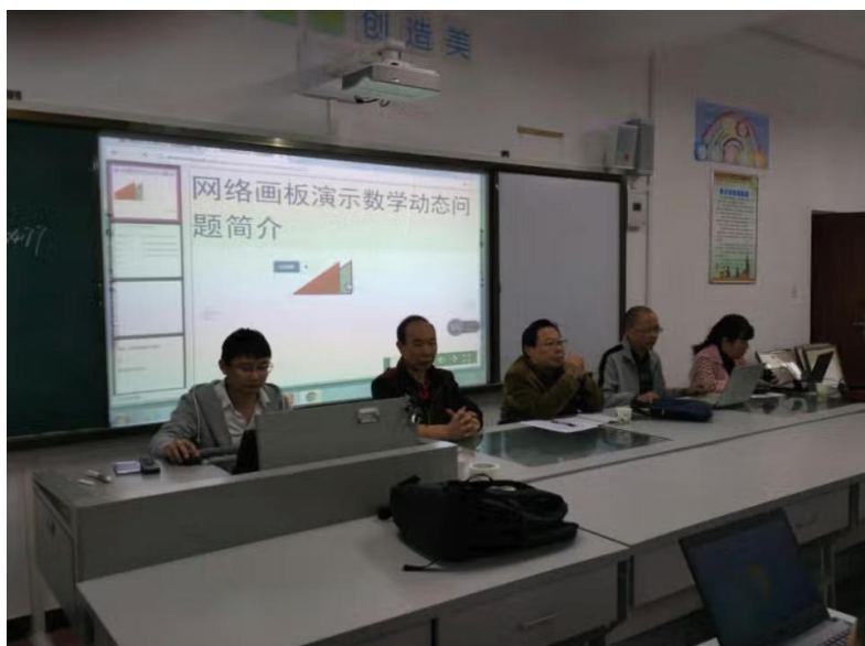
2017 年 雅安市初中数学工作坊研讨会